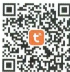
Tuya Smart APP