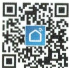
Smart Life APP